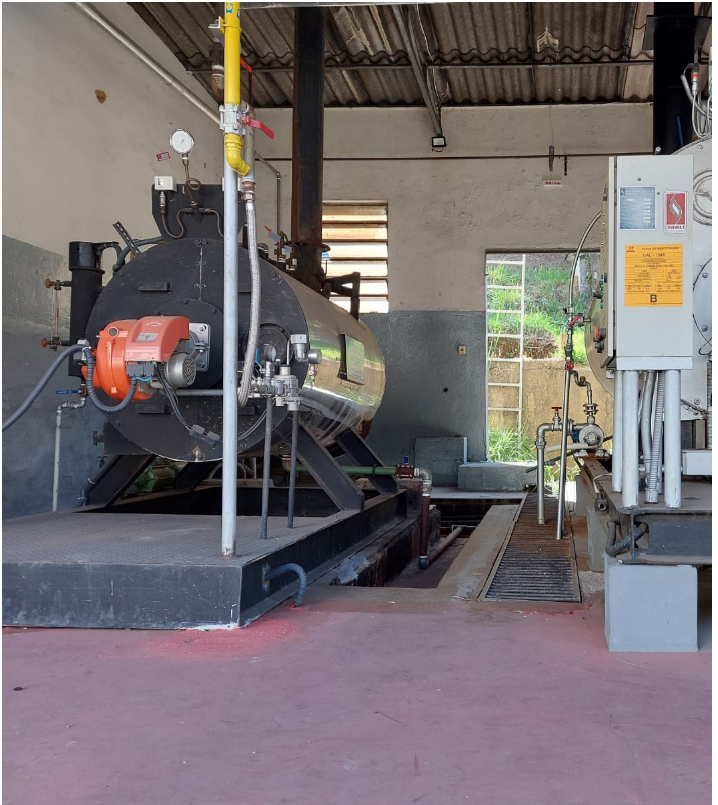
Foto1 Caldeira Benatti e Simili