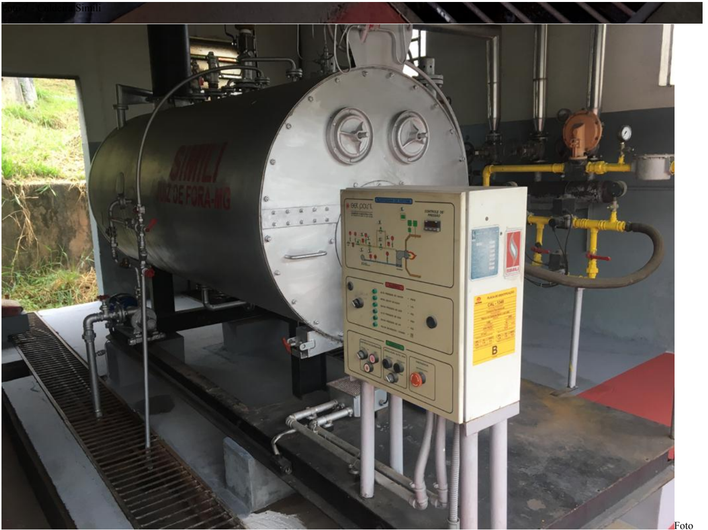
8 - Caldeira Simili