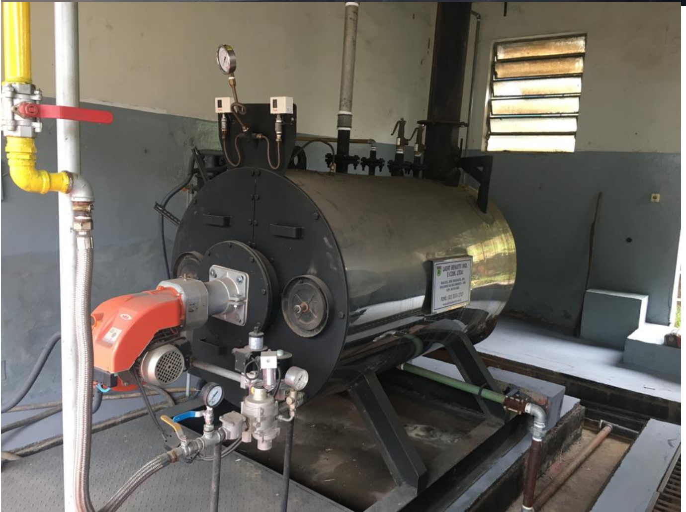
Foto 5 - Caldeira Benatti